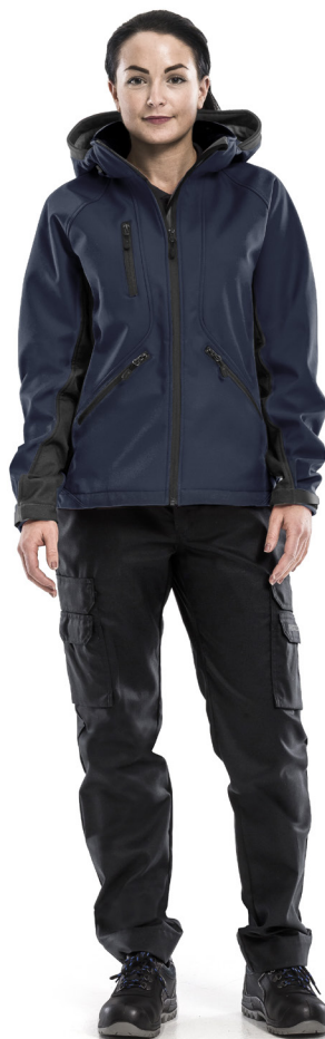
ACODE VESTE SOFTSHELL WINDWEAR FEMME 1416 SHI Code article 124150