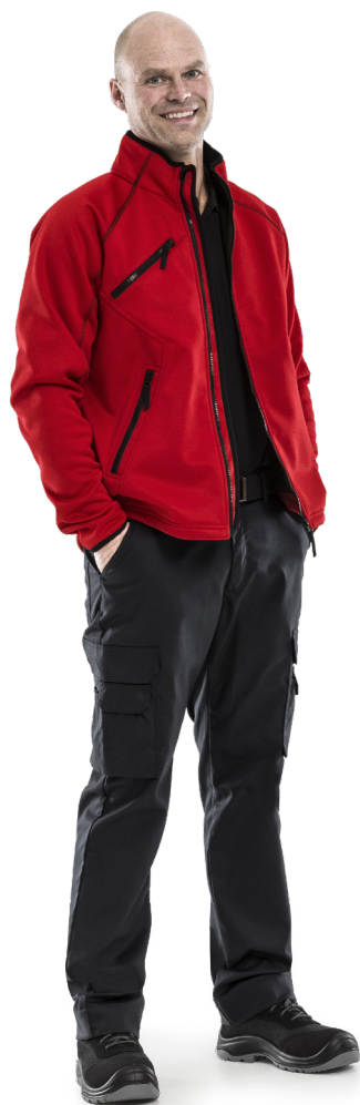
VESTE SOFTSHELL STRETCH 4905 SSF Code article 120962

Nos nouveaux pantalons sont parfaits pour tous ceux qui travaillent dans le secteur du service, du commerce de détail ou de la distribution. Ils sont faits d'une matière durable et légère avec stretch mécanique, ce qui les rend très agréable à porter. Nous les avons équipés de poches fonctionnelles adaptées aux professions de service et elles sont approuvées pour le lavage industriel. Combinez-les avec nos vestes, sweat-shirts, polos et accessoires pour un look bien habillé au travail.